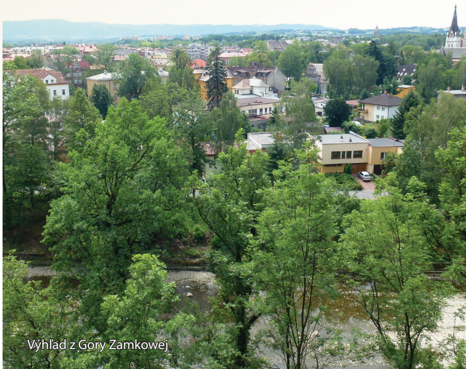
Výhľad z Gory Zamkowej