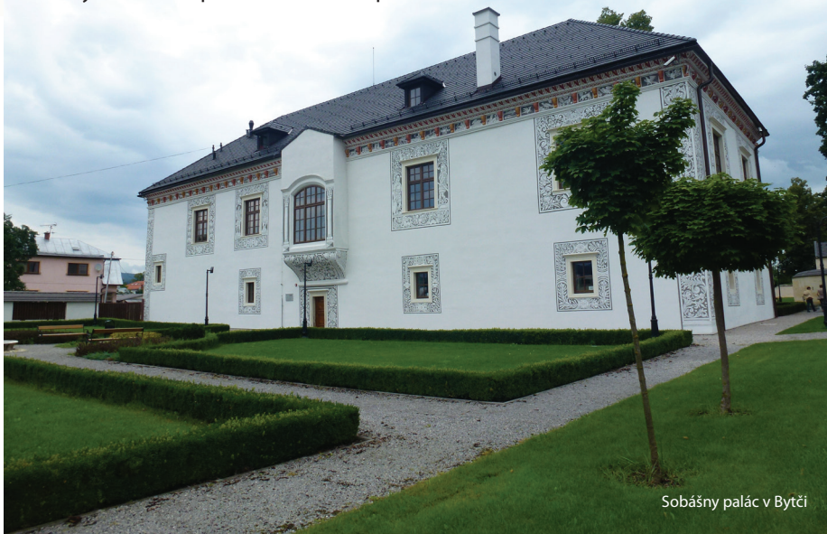
Sobášny palác v Bytči