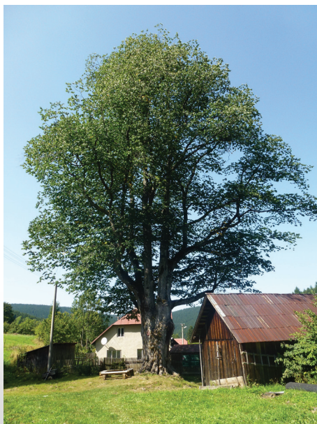
Brest v Makove