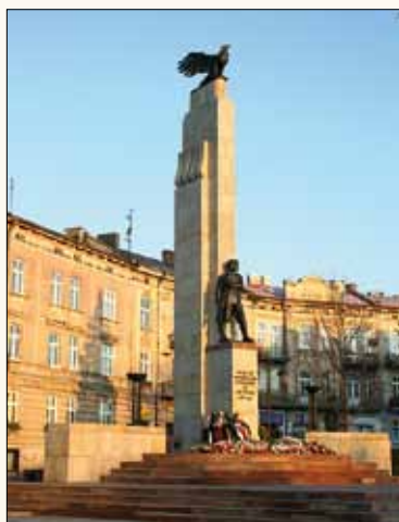
Pamätník Przemyských orlíčat

Z námestia Przemyských orlíčat prechádzame na susedné námestie Ústavy 3. mája, ktoré sa nachádza na pravej strane. Na jeho pravej strane uvidíme opátstvo benediktínok , založené v 17. storočí, najstaršiu pamiatku Zasania. Po poškodeniach v dôsledku nájazdov bolo