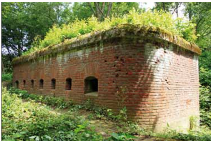
Pevnosť XVIc „Tri kríže“

mostíka. Pokračujeme ďalej alejou, míňajúc altánok a prichádzame k tehlovej Hornej Sanockej bráne , postavenej v 80. rokoch 19. storočia. Je súčasťou hlavnej časti opevnenia vnútorného prstenca Pevnosti Przemysl, spájajúceho Dolnú Sanockú bránu s pevnosťou XVIc „Tri kríže“. Pred nami je dávnejšie odlesnené Návrsie Troch krížov (289 m n. m.), na ktorom niektorí vedci lokalizujú obranný hrad z ranného stredoveku, kde tiež uvidíme pozostatky opevnenia z 19. storočia. Značky chodníka zabočujú z aleje doľava k zachovaným fragmentom pevnosti XVIc „Tri kríže“ .