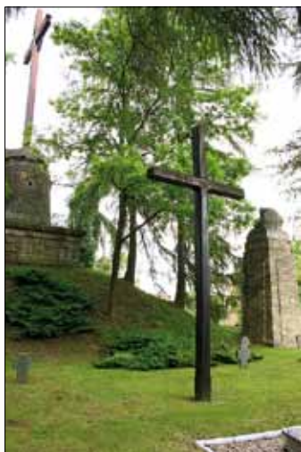
Cintorín rakúsko-uhorských vojakov

Na ulici Boleslava Smelého nie je možné prehliadnuť kríž vyrobený v roku 1916 z väzníkov mostu na rieke San, zničeného výbuchom. Dominuje cintorínu rakúsko-uhorských vojakov, padlých počas 1. svetovej vojny v bojoch o Pevnosť Przemysl. V blízkosti cintorínskej kaplnky z roku 1916 sa nachádzajú aj mohyly vojakov Poľskej armády, padlých v septembri 1939 v bojoch s Ukrajinskou povstaleckou armádou a hroby vojakov Krajinskej armády.