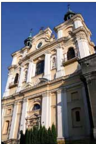
Gréckokatolícka arcibiskupská katedrála

V hornej časti Námestia nezávislosti chodník odbočuje do ulice biskupa Jana Šnigurského, vyúsťujúcu na námestí Tadeusza Czackého. Uvidíme pri ňom niekdajší gréckokatolícky biskupský palác a gréckokatolícku arcibiskupskú katedrálu z 19. storočia.