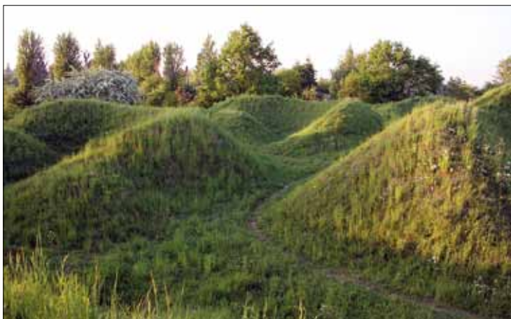
Časť opevnenia XIX „Vínny vrch“

„Jamy“ s výskytom v našej krajine zriedkavého ľanu rakúskeho.