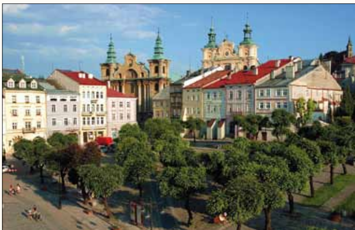
Námestie v Przemysli

Chodník začína a končí pri južnom priečelí unikátneho nakloneného Staromestského námestia .