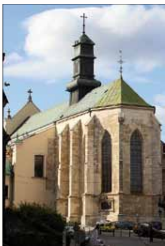
Rímskokatolícka arcibiskupská katedrála

Chodník vedie na juh, nahor krátkou a úzkou ulicou Aleksandra Fredra. Odtiaľ sa stáča doprava a privádza nás k rímskokatolíckej katedrále .