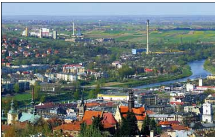
Výhľad z návršia Zniesienie

lanovkou a bobovou dráhou. Vychádzame na najvyšší bod návršia Zniesienie (353 m n. m.), ktorého názov je odvodený zo starých povestí o porážke („zmietnutí“) Tatárov, útočiacich z tohto miesta na Przemysław. Zniesienie je najvýchodnejšou časťou Przemysláckeho pohoria a celých Západných Karpát. Pred nami sa nachádza stožiar televíznej veže z roku 1962.