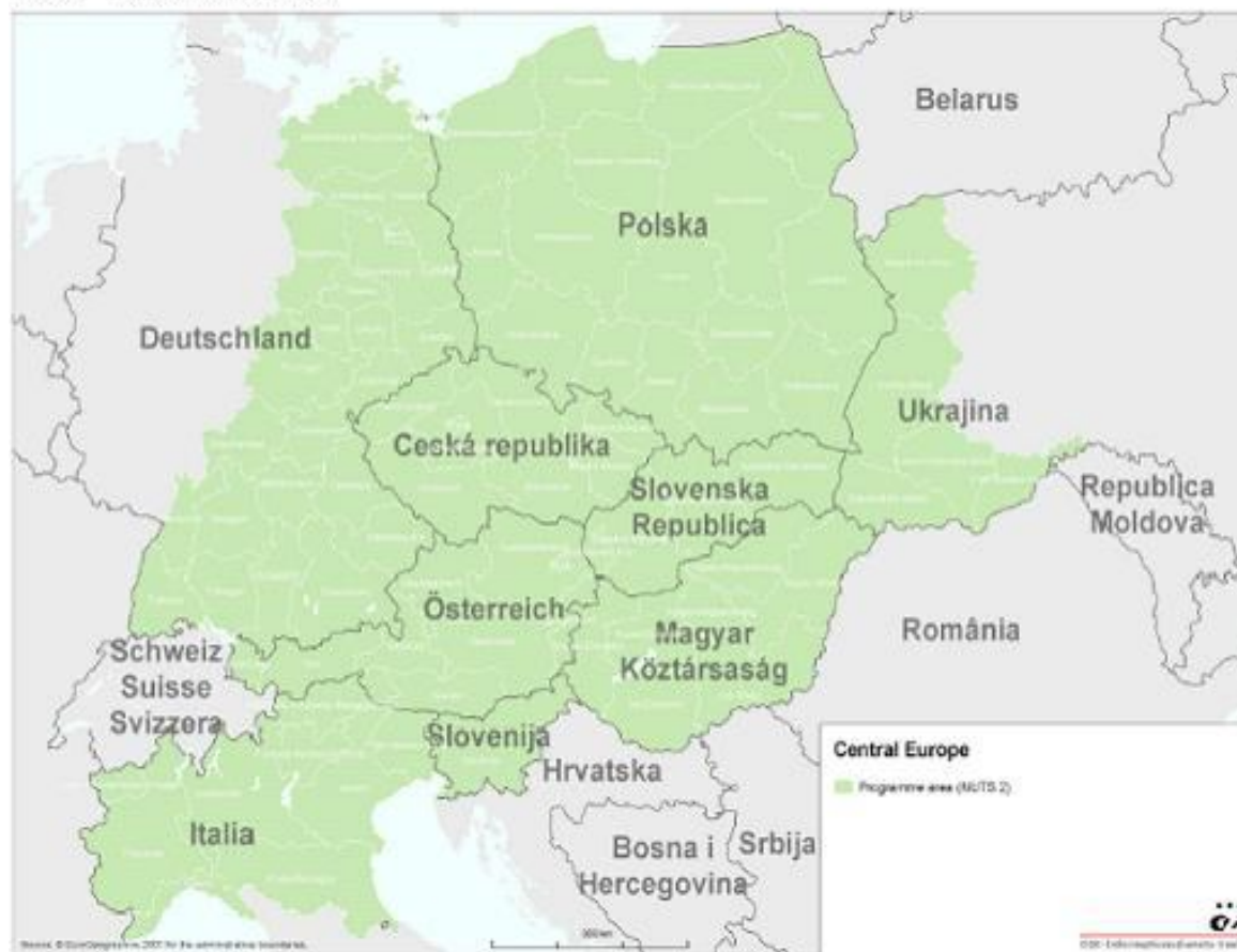
Map 1: Programming area