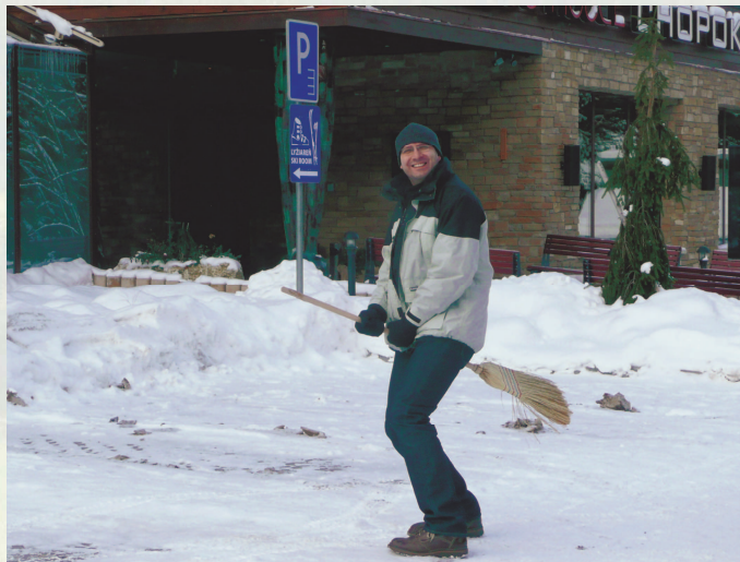
Rozhodnutia boli prijaté, nastal čas vrátiť sa do Krakova – všetkými dostupnými dopravnými prostriedkami

Zoznam schválených projektov a zásobníkov sú zverejnené na webovej stránke Programu www.plsk.eu v záložke Hodnotenie projektov – Zoznam schválených projektov.