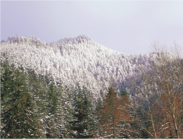
Prestávky počas rokovaní boli ešte príjemnejšie vďaka krásnemu výhľadu

Okrem toho rozhodol Monitorovací výbor o vytvorení zásobníka projektov v členení podľa prioritných osí a oblastí podpory. Projekty, ktoré sa nachádzajú v zásobníku, môžu získať finančný príspevok v prípade, že v Programe vzniknú úspory alebo v prípade, že dôjde k realokácii prostriedkov medzi prioritami a oblasťami podpory.