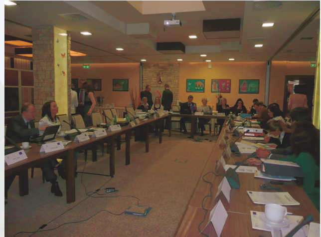
Rokovanie Monitorovacieho výboru